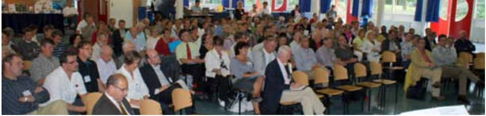
Zaaloverzicht van het EA-symposium 'Als het spannend wordt...' 2009